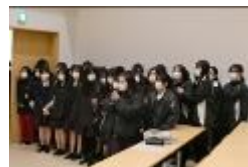
看護科3年生も応援にかけつけました→