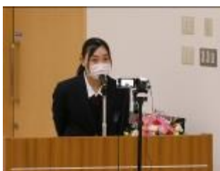
どの生徒もしっかりまとめられており、堂々と発表できました